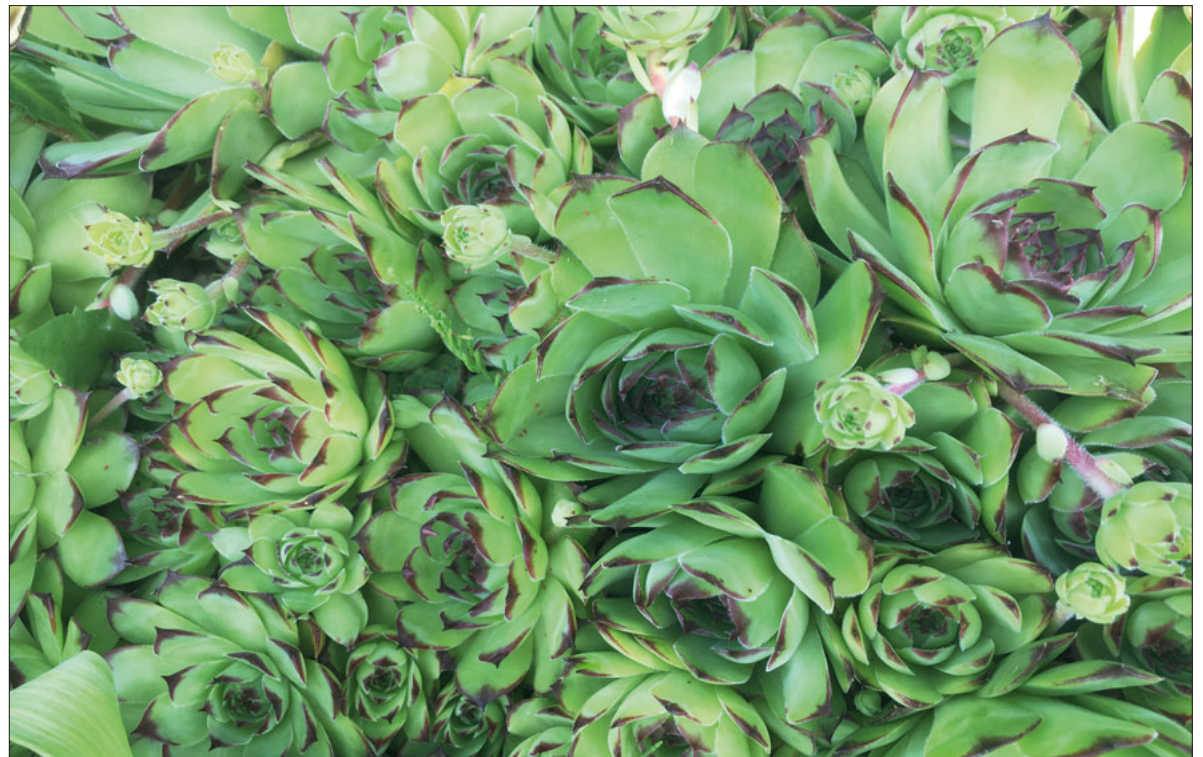
Sich an der Natur erfreuen und Hoffnung schöpfen.