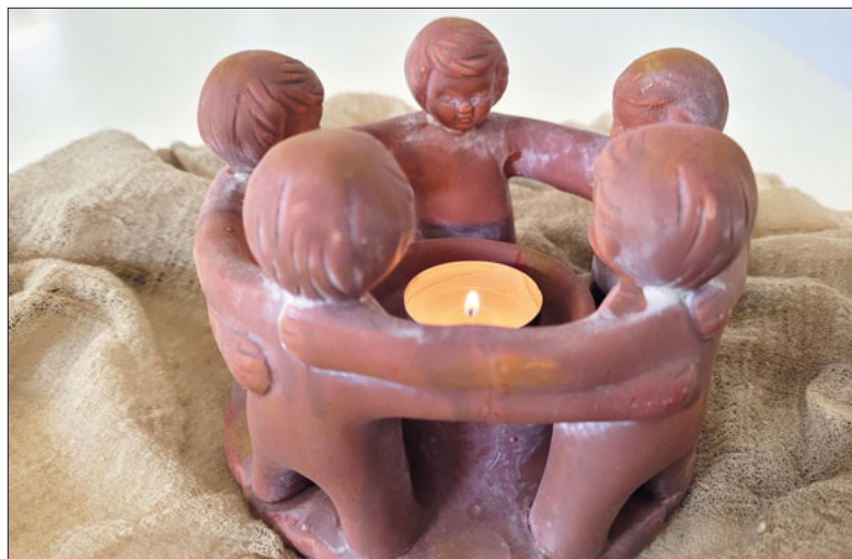
«Jesus, üsi Metti» – ein Fest des Glaubens.

Aufgrund der neuesten Mitteilungen des Bundesrates hinsichtlich der Corona-Situation finden die Festgottesdienste der Erstkommunionfeiern in der Pfarrkirche Bruder Klaus neu am Samstag, 26. Juni und am Sonntag, 27. Juni statt.