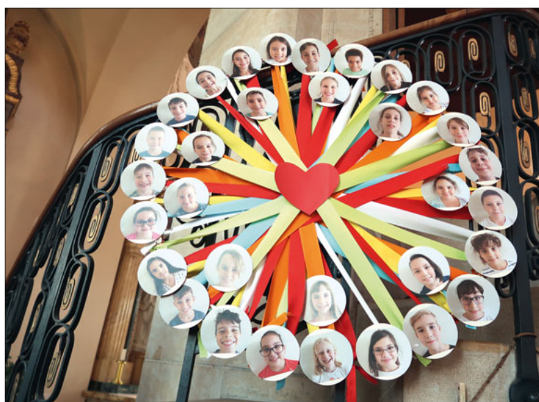
«Jesus, üsi Metti» heisst das Motto der Erstkommunion.

Aufgrund der neuesten Mitteilungen des Bundesrates hinsichtlich der Corona-Situation finden die Gottesdienste der Erstkommunionfeiern in der Pfarrkirche Gerliswil neu am Samstag, 26. Juni und am Sonntag, 27. Juni statt.