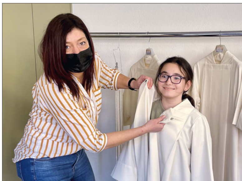
Die 3.-Klass-Kinder freuen sich auf die erste Heilige Kommunion.

Das Leitwort der Erstkommunionfeiern zum Weissen Sonntag lautet «Jesus, üsi Metti». 33 Kinder aus den Pfarreien St. Maria und St. Mauritius Emmen werden am Wochenende vom 26./27. Juni in die eucharistische Mahlgemeinschaft aufgenommen. Coronabedingt können die Gottesdienste nicht öffentlich gefeiert werden.