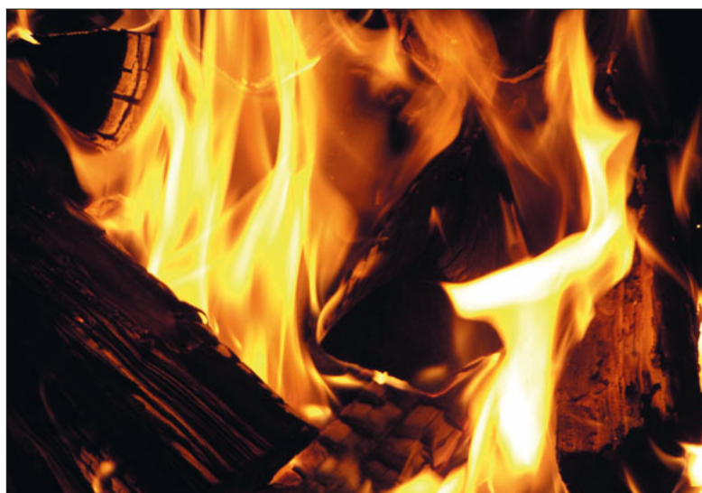
Ostern: Licht der Hoffnung.

Jesus Christus ist auferstanden. Das ist das Zentrale des christlichen Glaubens. Auf diesen Höhepunkt soll man sich in der Fastenzeit vorbereiten. Abgeschlossen wird das Ostergeschehen an Pfingsten.